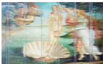
ohne spezielle Behandlung

Die Exolon Group bietet ein komplettes Portfolio an Polycarbonat-Stegplatten für die unterschiedlichsten Bedürfnisse an. Für die Herstellung von Trennwänden empfehlen wir eine Plattendicke von weniger als 16 mm, um eine ausreichende Leichtigkeit der Struktur zu gewährleisten. Alle Platten sind in verschiedenen Farben erhältlich (Opal, Bronze, Blau, Grün), um spezifische Designanforderungen zu erfüllen.