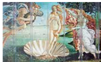
mit spezielle Behandlung